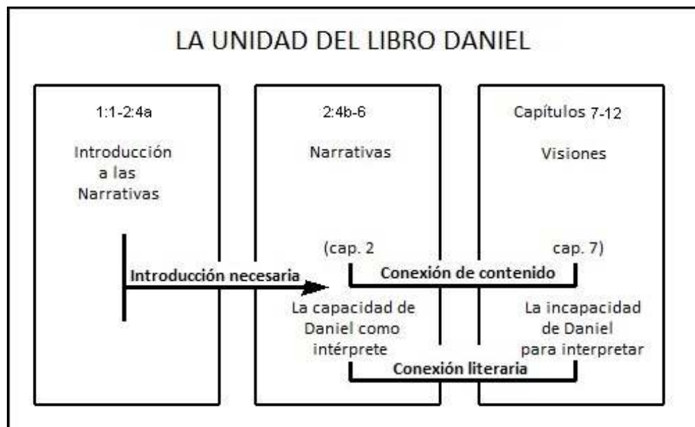
Diagrama 2 (adaptado y traducido de Smith)